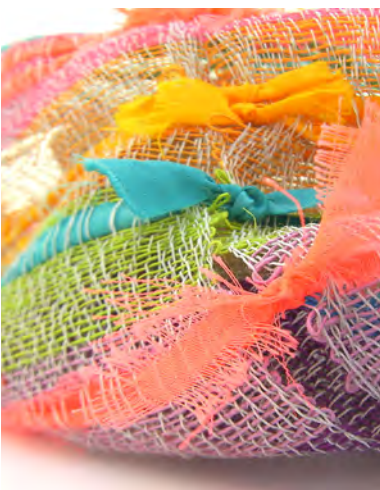
Kraag in linnen