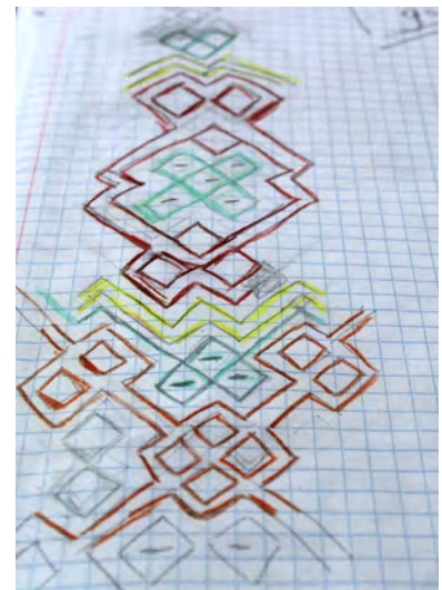
Lab O drawing