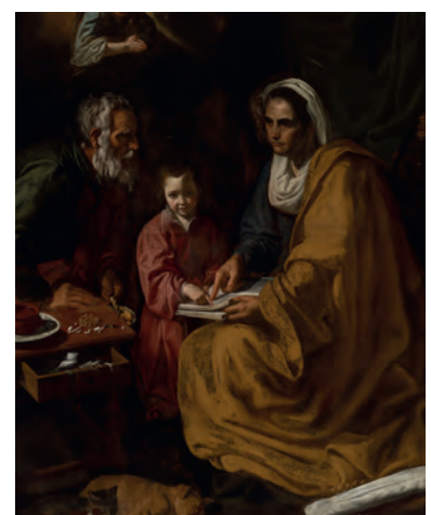
Diego Velázquez, Spanish, 1599–1660 The Education of the Virgin