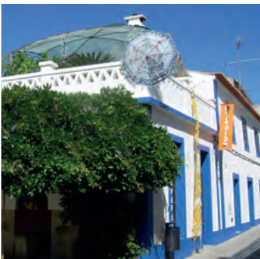
Atelier Lab O