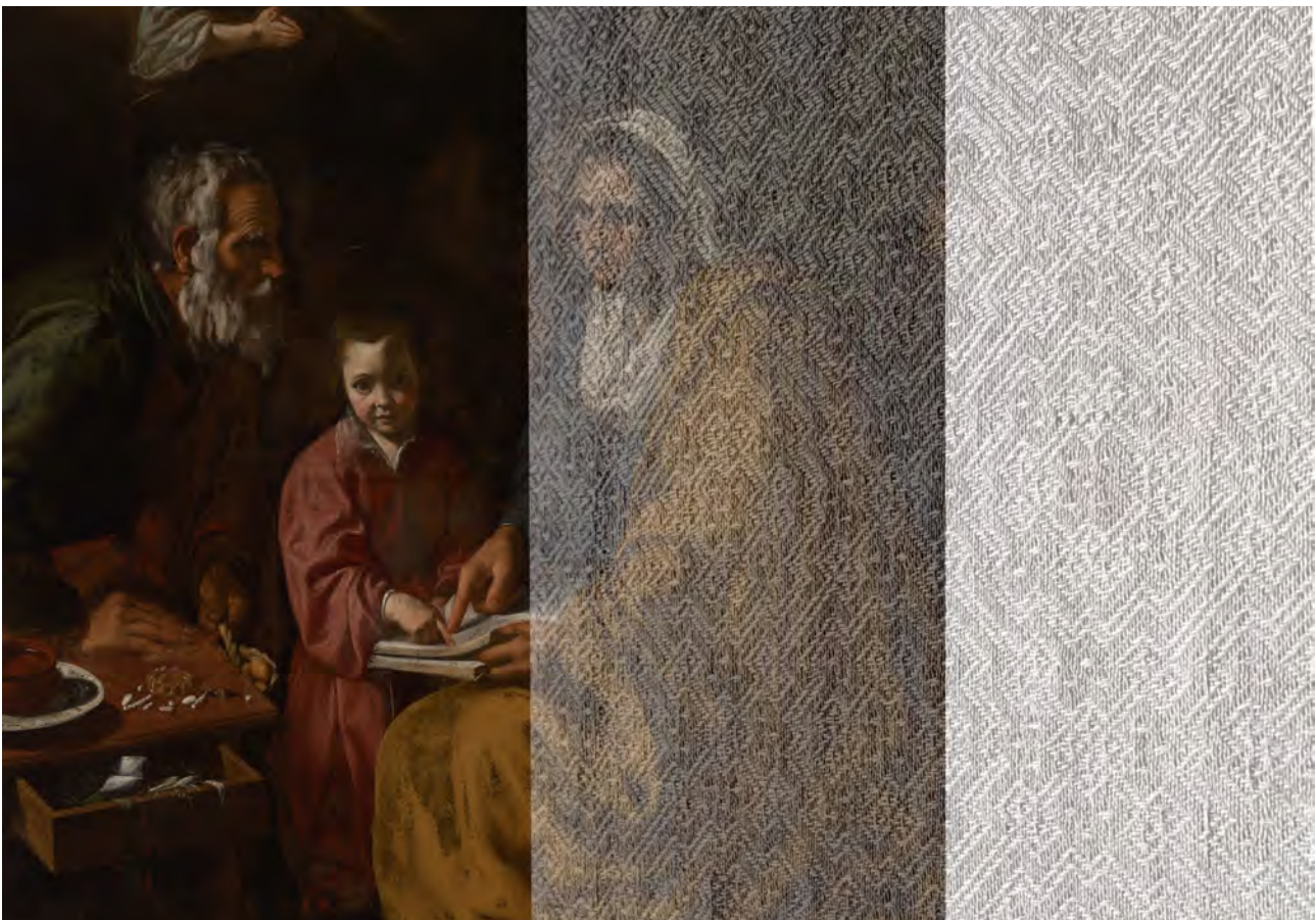
Schilderij Velázquez met nageweven canvas