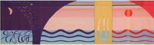
Antependium Rotterdam MC