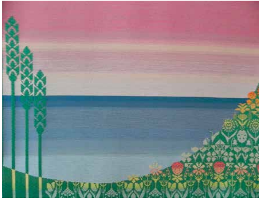
Detail groen kleed voor Rotterdam MC