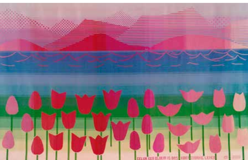
'Gelijk een bloem is ons kortstondig leven'

De wol die ze gebruikt heeft is afkomstig van Hillesvåg, Noorwegen. Door de combinatie van deze wol met één gemercenterde draad katoen van Venne krijgt ze sprekende kleurnuances.