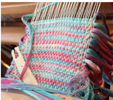
De bundels zijden kettingdraden zijn geweven in de wegwerpketting