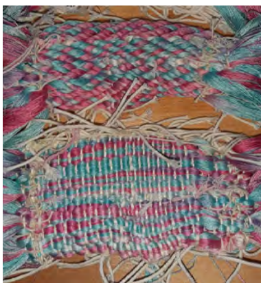
De in de wegwerpketting geweven bundels kettingdraden, stevig aangetrokken en vastgeknoopt