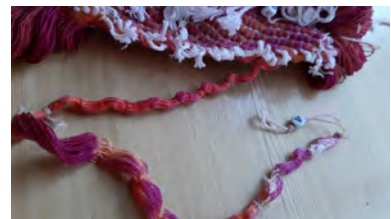
Het loshalen van de afbindtouwjes om de nu ikat geverfde zijden kettingdraden

Na het voorzichtig loshalen van alle knoopjes en weefsels en het scheren van de smalle banen (1 centimeter breed) was al het voorwerk klaar en kon de ketting op het getouw worden opgeboomd. Het weven kon beginnen. Ik geniet altijd enorm van het hele proces om tot een ikat te komen. Elke stap is spannend, je weet nooit precies hoe het resultaat wordt, hoeveel proefweefsels en verfproeven je vooraf ook maakt.