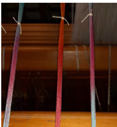
Het markeren van de 15 cm lange afbindingen in de zijden ketting

Voor het veertigjarig jubileum van onze weefkring Midden-Limburg is een aantal weefsters aan de slag gegaan om een droomjas te maken. Die jassen zijn vorig najaar op de jubileum-exposities in Roermond en Nederweert getoond. Voor het maken van mijn droomjas heb ik gekozen voor twee ikatweefsels. Die zijn verwerkt tot twee lagen stof, waardoor de jas aan twee kanten te dragen is. Het is een opvallend model met vleermuismouwen.