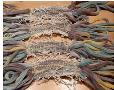
De wollen kettingdraden, nog in de stevig aangetrokken en vastgebonden wegwerpketting

Deze pakketjes konden nu geverfd worden, de wollen ketting in een jadegroen verbad met een volle kleurintensiteit. Een extra streng garen is meegeleverd voor de effen banen in het weefsel in 1/2 keper. De inslag heb ik apart geverfd, in dezelfde kleur met dezelfde intensiteit.